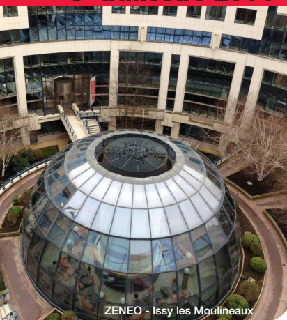
ZENEO - Issy les Moulineaux