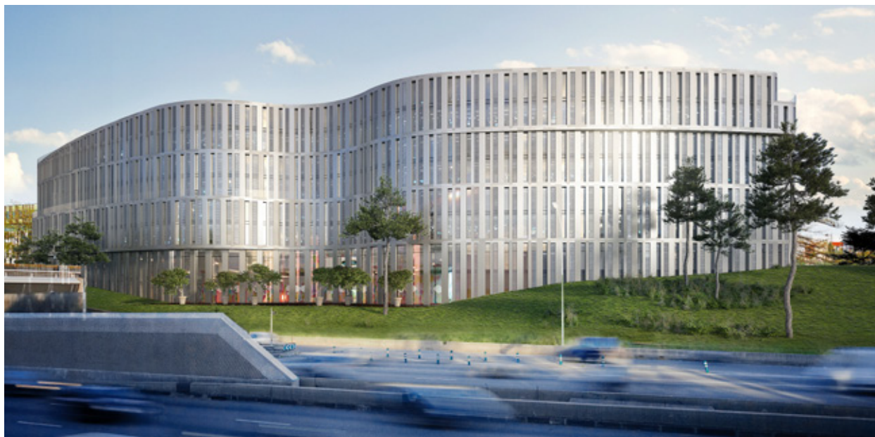
Rue Paul Meurice - 75020 PARIS