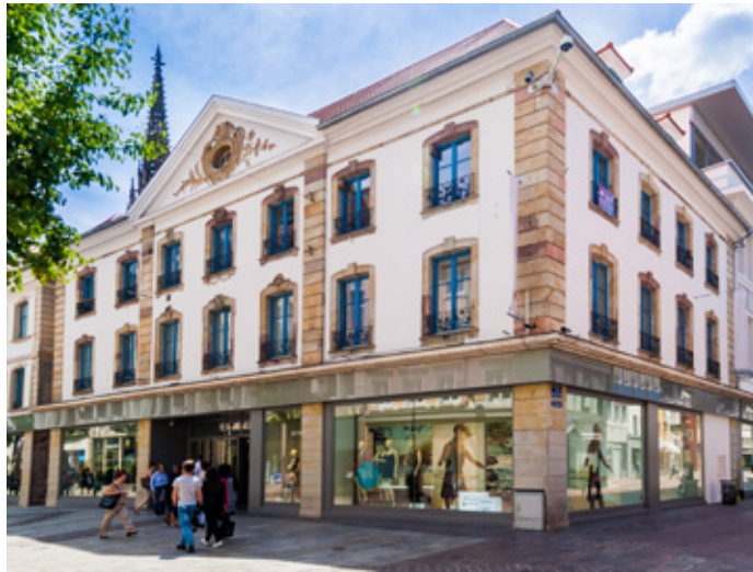
37-39 Rue du Sauvage - 68200 MULHOUSE