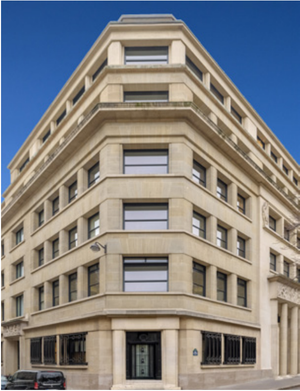
53 Quai d'Orsay - 75007 PARIS