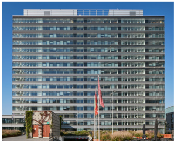
Prinses Beatrixlaan 5-7 - LA HAYE (PAYS BAS)