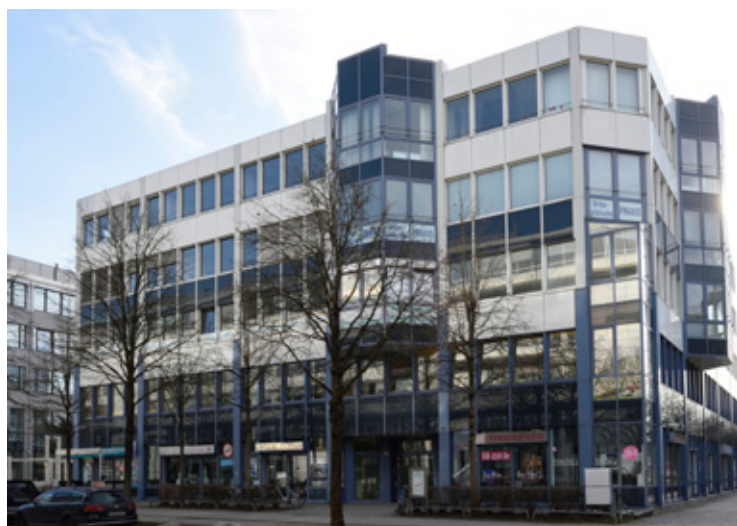
Gustav Heinemann Ring 125 - MUNICH (ALLEMAGNE)