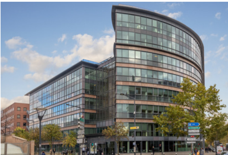
266 Avenue du Président Wilson - 93210 SAINT-DENIS