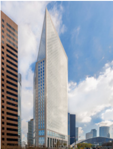
Tour Égée - 9-11 Allée de l'arche - 92400 COURBEVOIE