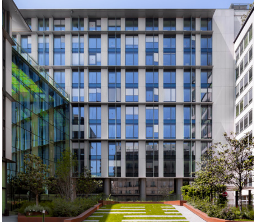
2- 8 Rue Ancelle - 92200 NEUILLY-SUR-SEINE