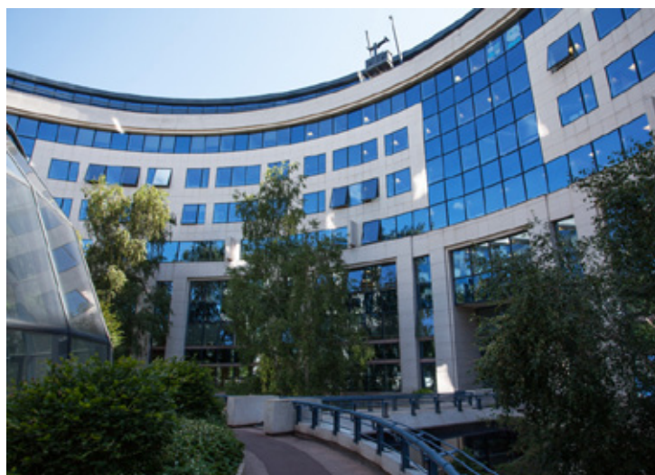
14, Boulevard des frères voisin - 92130 ISSY-LES-MOULINEAUX