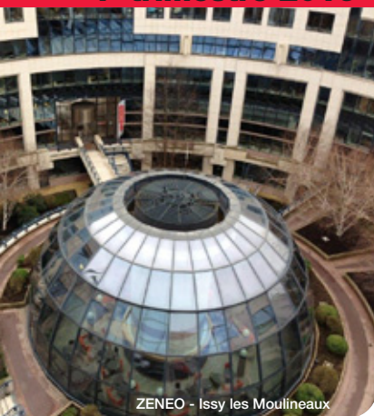
ZENEO - Issy les Moulineaux