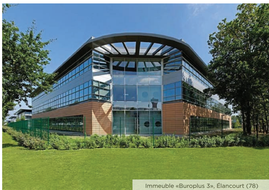
Immeuble «Buroplus 3», Élancourt (78)